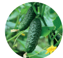
Cetriolo e zucchini (pieno campo e serra)