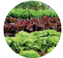
Lattughe e simili (pieno campo e serra)