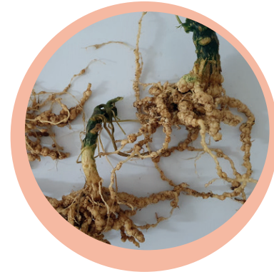
Galle su radici di zucchini