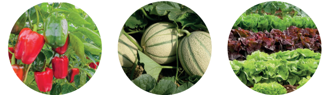
Pomodoro, Melanzana, Peperone (pieno campo e serra)

OIKOS è autorizzato per l'impiego in fertirrigazione contro i nematodi e la maggior parte degli insetti dannosi per l'apparato aereo delle colture orticole, della fragola, del tabacco e della carota .