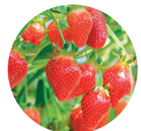
Fragola (pieno campo e serra)